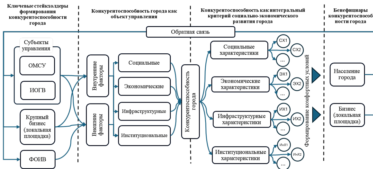
Рис. 1. Конкурентоспособность как объект управления и интегральный критерий социально-экономического развития города