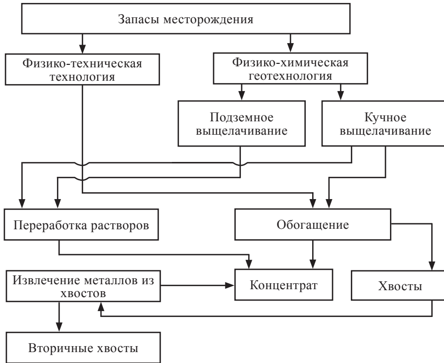
Рис. 2. Комбинированное выщелачивание металлов Fig. 2. Combined solvent extraction of metals

переработки и отбойка бедных руд для выщелачивания. При этом вынимаемая традиционным способом богатая руда создает компенсационное пространство для дробления остальных руд.