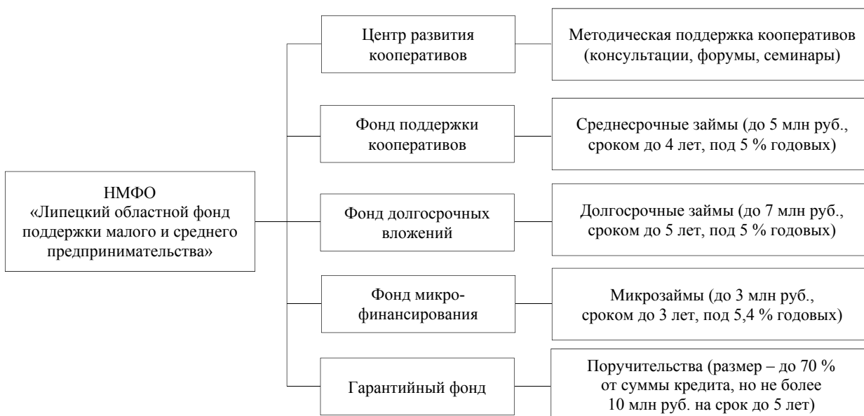
Рисунок 2 – Трехуровневая система управления развитием кооперации в Липецкой области