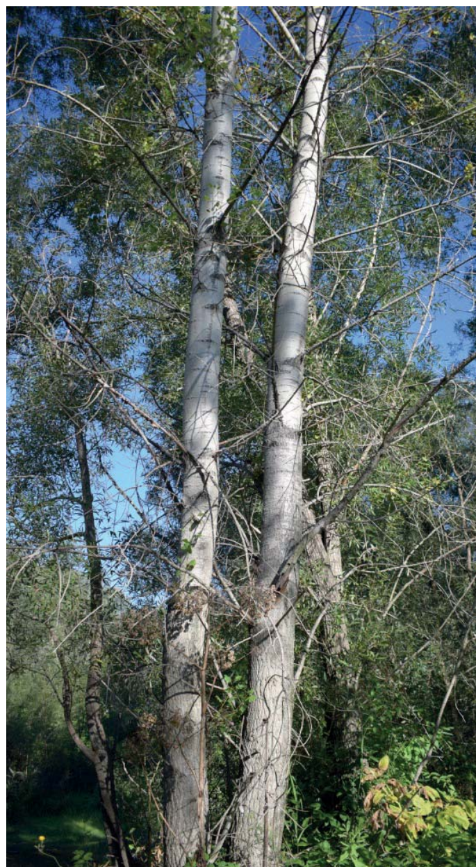
Рис. 1. Белокобая форма P. nigra , река Катунь Fig. 1. The white-bark form of P. nigra the Katun River

У тополя лавролистного из декоративных разновидностей известна иволистная форма – f. lindleyana (Carr.) Aschers. et Graebner – на длинных побегах листья ланцетные, а на коротких – узкоэллиптические, по краям и те и другие волнистые [25].