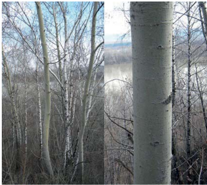
Рис. 4. Зеленокорая форма P. laurifolia , долина реки Томи Fig. 4. The green-bark form of P. laurifolia the valley of the Tom River