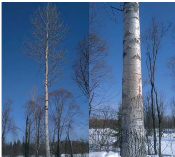
Рис. 3. Белокорая форма P. laurifolia , река Верхняя Терсь Fig. 3. White-bark form of P. laurifolia the Verkhnyaya Ters' River

Для зеленого строительства и селекционной работы наибольшую ценность представляют белокорая и зеленокорая формы P. laurifolia , отличающиеся компактной кроной из тонких ветвей, декоративной коркой, хорошим очищением от сучьев и высокой укореняемостью одревесневших черенков.