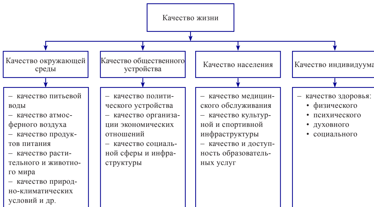
Рис. 2. Структурные элементы качества жизни территории Fig. 2. Structural elements of life quality on the territory

с учетом международной терминологии. К базовым структурным составляющим данного термина относятся следующие: продолжительность жизни и сведения о здоровье населения, уровень жизни, образ жизни людей (рис. 2).