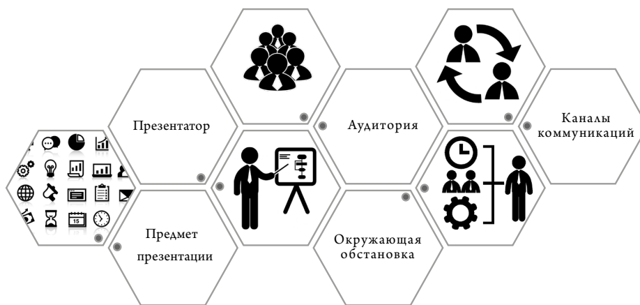
Рис. 2. Основные элементы «презентационного поля» Fig. 2. The main elements of the "presentation field"

Когда ставка высока, необходимо подготовиться как следует, хорошо продумать не только содержание, но и форму, стиль презентации. Если для короткого выступления может потребоваться несколько часов подготовки, то для масштабной презентации, рассчитанной на более долгий