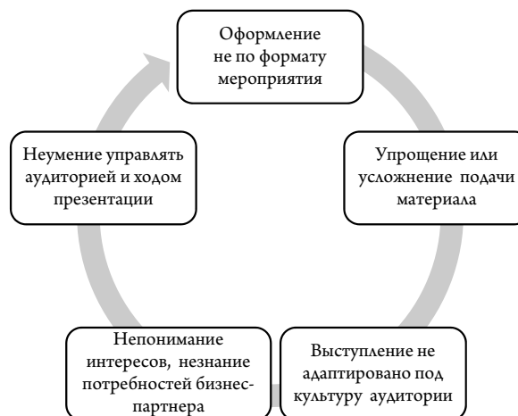
Рис. 3. Основные ошибки при презентации коммерческого предложения [9]

Говоря о любом формате бизнес-презентации, нельзя забывать о том, какие последствия она несет. В соответствии с базовым принципом эффективности можно определить эффективность выступления как соотношение